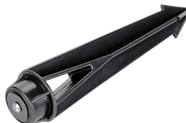
Рис. 3. Основание для установки в грунт (арт. 024888)