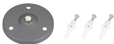
Рис. 2. Основание для установки на поверхность (арт. 024890)