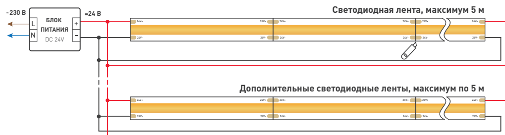
Схема 1. Подключение нескольких светодиодных лент с двух сторон Рекомендуется использовать для обеспечения равномерного свечения ленты по всей длине.