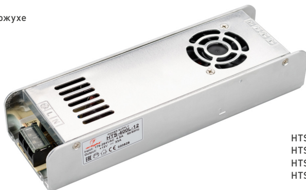
HTS-300L-12 HTS-300L-24 HTS-400L-12 HTS-400L-24